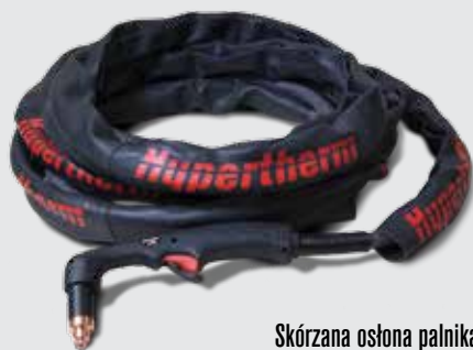
Skórzana osłona palnika