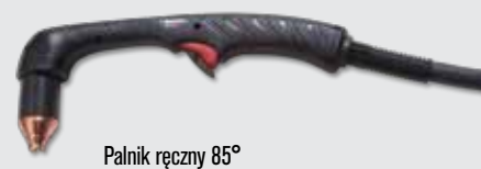
Palnik ręczny 85°

(więcej opcji palników można znaleźć w witrynie www.hypertherm.com )