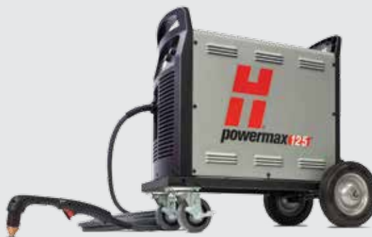
Wózek z kółkami