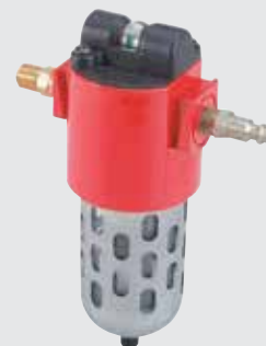
Zestaw do filtrowania powietrza