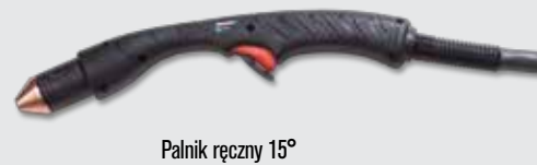
Palnik ręczny 15°