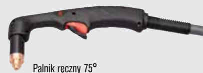
Palnik ręczny 75°

(więcej opcji palników można znaleźć w witrynie www.hypertherm.com )