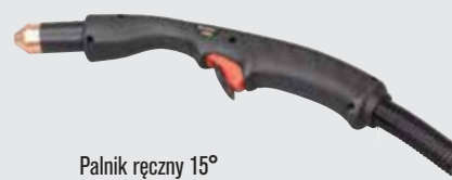
Palnik ręczny 15°